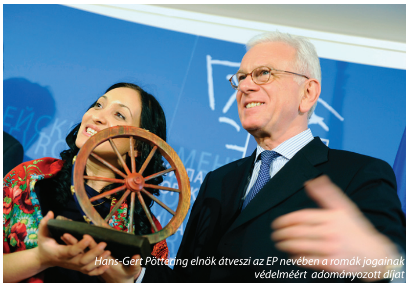
Hans-Gert Pöttering elnök átveszi az EP nevében a romák jogainak védelméért adományozott díjat

Az Alapjogi Chartát, amelyet az európai intézményeket, a nemzeti parlamentek képviselőit, jogászokat, egyetemi szakembereket és a civil társadalom képviselőit