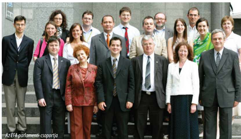
Az EFA parlamenti csoportja