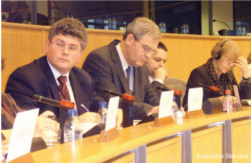
Becsey Zsolt és Tökés László

Vajdaságról és az ott élő magyarok helyzetéről tartott közmeghallgatást 2009. április 1-jén Becsey Zsolt és Tökés László európai parlamenti képviselő, „Elfeledte-e a Vajdaságot az Európai Parlament?” címmel. A magyarokat ért atrocitások kivizsgálására 2005-ben küldött európai parlamenti vizsgálóbizottság jelentését annak elkészülte óta nem mutatták be, ez indokolta a fórum megtartását.