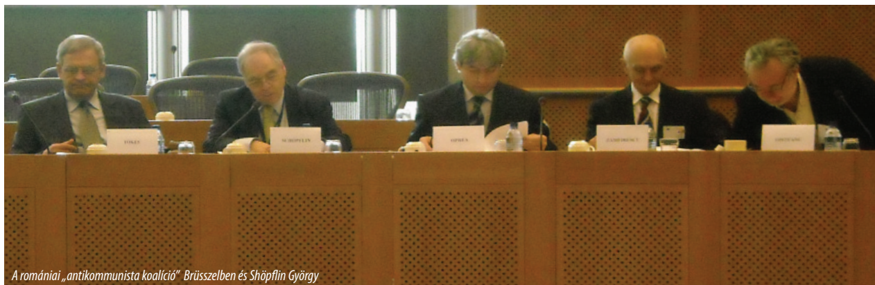
A romániai „antikommunista koalíció” Brüsszelben és Shöpfung György

Ellen kell állnunk mindenféle ún. liberális történelmi relativizmus ferdtételeinek, amelyek megpróbálják csökkenteni a kommunizmus borzalmait, a nácizmus, az apartheid rémségeivel vagy akár a nemi megkülönböztetéssel hasonlítva össze, ily módon mindmáig megtagadva egy igazságos per lefolytatását a kommunista diktatúrák központosított gépezete által üldözöttek, megkínzottak és meggyilkoltak millióitól.