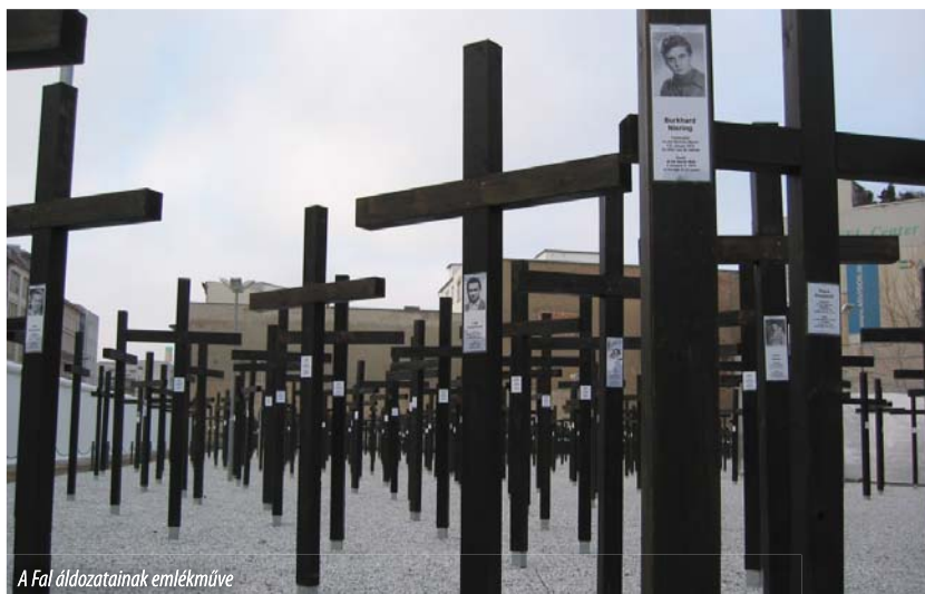
A Fal áldozatainak emlékműve

gon és az erőszakon alapul.” Ezekhez szorosan kapcsolódva: a totalitárius diktatúra másik két lélektani tartópillére a félelem és a – belőle fakadó – hallgatás. Ezekkel találta szemben magát a börtönfalnak számító vasfüggöny másik oldalán, a volt keleti tömb – a szovjet-orosz láger – országainak valamennyi állampolgára, köztük is fokozott mértékben az utolsó sztálini-bolszevik típusú kommunista diktatúra, a Ceaușescu-rezim megfélemlített és elnémított alattvalói.