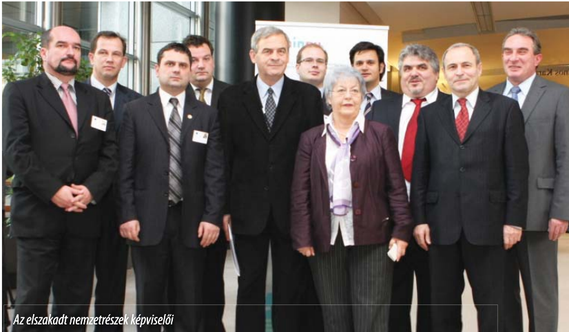
Az elszakadt nemzetrészek képviselői

A Magyar Nemzeti Kisebbségek Európai Képviseleti Irodája (HUNINEU) szervezésében 2009. december 1-én, a Lisszaboni Szerződés életbelépésének napján tartottak sajtótájékoztatót a Magyarország határain kívül élő magyar közösségek vezető képviselői Brüsszelben, az Európa Parlament épületében.