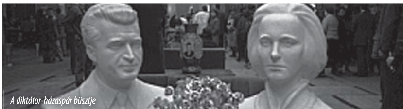
A diktátor-házaspár büszkje

Amint azt a sajtó már hírül adta, a német egység helyreállításával, valamint az európai integrációval kapcsolatos történelmi döntések helyszínén, a bonni parlament egykori épületében kezdte meg kongresszusát az Európai Néppárt ma, 2009. december 10-én (EPP).