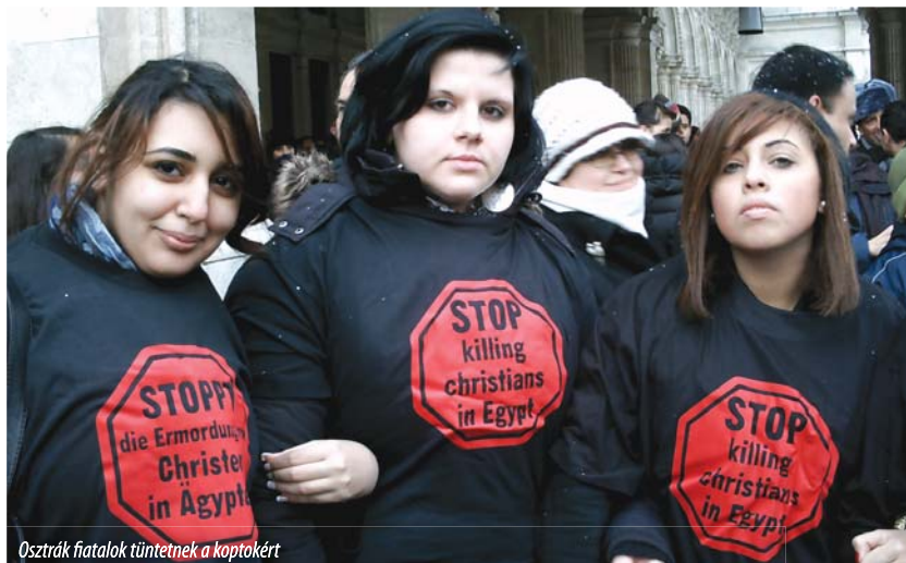
Osztrák fiatalok tüntetnek a koptokért

O. mivel a népek közötti béke és kölcsönös megértés elősegítéséhez elengedhetetlen a közösségek közötti párbeszéd,