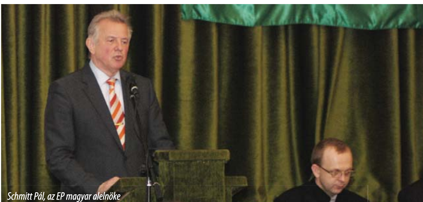
Schmitt Pál, az EP magyar alelnöke

Tőkés László közölte: az EMNT a 2010-es esztendő Trianoni Emlékévként nyilvánította, a szervezőbizottságot már megalakították, és készítik az emlékévké programját. Az