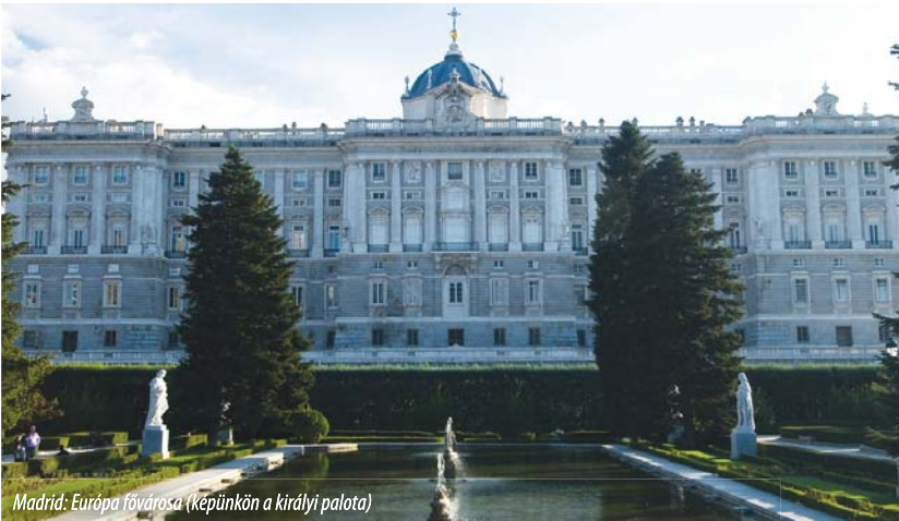
Madrid: Európa fővárosa (Képeinken a királyi palota)

Az Európai Parlament Emberi Jogi Bizottságának (DROI) mai napirendjén a január 1-jével hivatalba lépett spanyol EU-elnökséggel folytatott eszmecsere szerepelt, a demokrácia és az emberi jogok területén követendő programjáról.