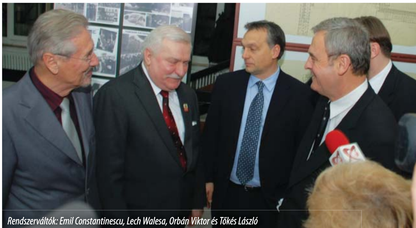
Rendszerváltók: Emil Constantinescu, Lech Walesa, Orbán Viktor és Tőkés László

Marosvásárhelyen megalakult a Vatra Românească nevű magyarellenes szervezet, szélsőjobboldali