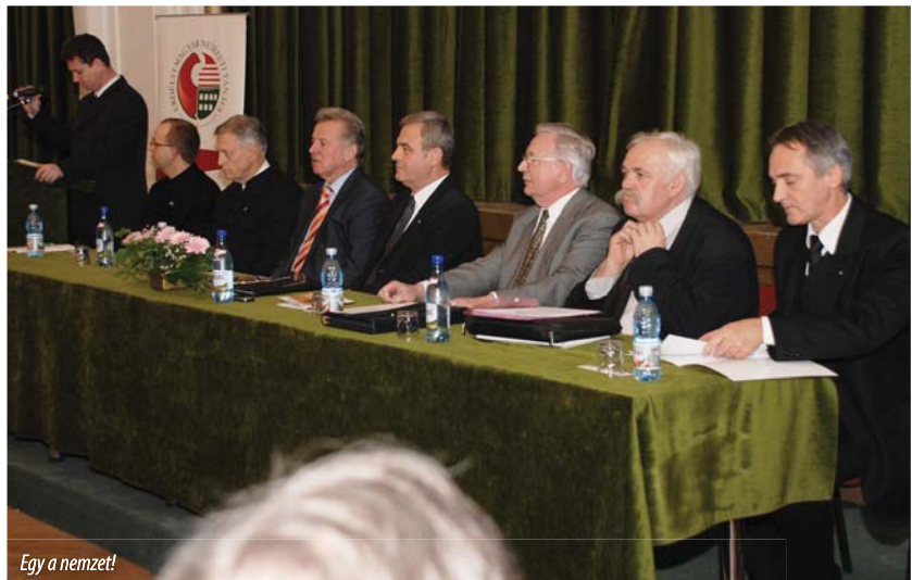
Egy a nemzet!

Zsúfolásig megtelt 2009. december 5-én, szombaton este a nagyváradi református püspöki palota díszterme, ahol Egy a nemzet címmel rendezett az Erdélyi Magyar Nemzeti Tanács (EMNT) és Tőkés László európai parlamenti képviselő irodája a külföldi magyarok kettős állampolgárságáról szóló, az elhíresült 2004. december 5-ei népszavazás ötödik évfordulója alkalmából megemlékező találkozót.