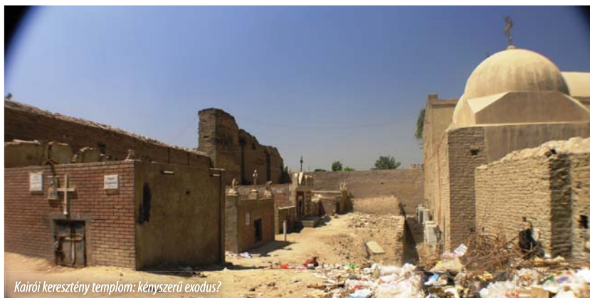
Kairói keresztény templom: kényszerű exodus?

1. hangsúlyozza, hogy a gondolat-, a lelkiismeret- és a vallásszabadság olyan alapvető emberi jogok, amelyeket nemzetközi jogi eszközök garantálnak, és határozottan elítéli a vallásos, a hitüket elhagyó és a nem hívő személyek elleni, valláson vagy meggyőződésen alapuló erőszak, hátrányos megkülönböztetés és intolerancia minden formáját;