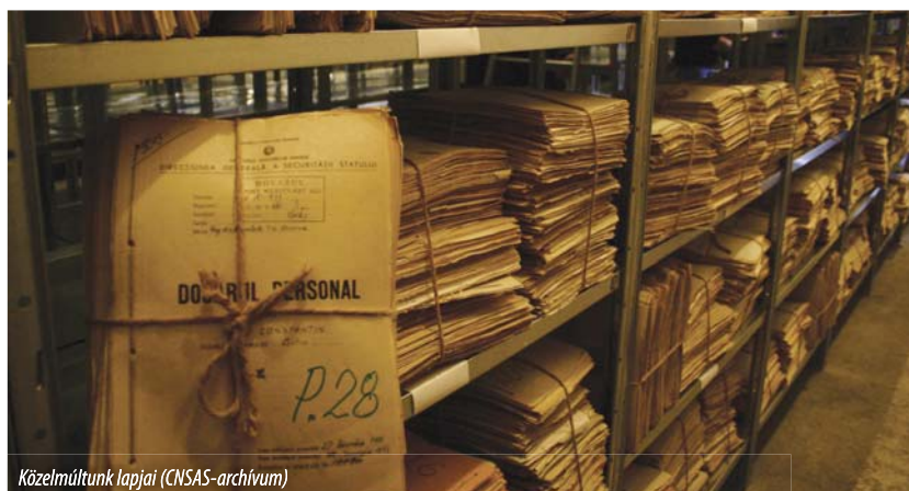
Közelmúltunk lapjai

Tunne Kelam szavaival szólva: „A kommunisták hatalma a hazugság ” ▶