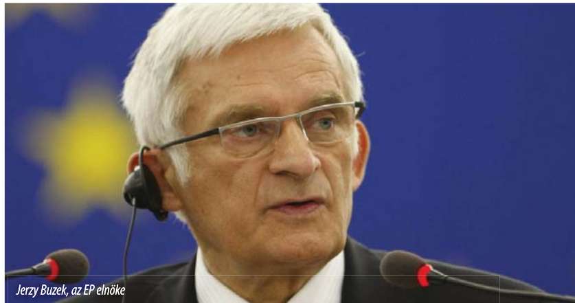
Jerzy Buzek, az EP elnöke

1980-ban, Gdanskban az én nemzedékem harcolni kezdett a