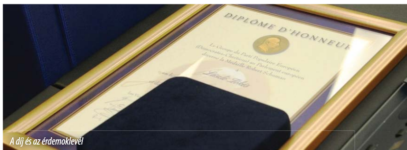
A díj és az érdemoklevél

Kérem, tapsolják meg kollégánkat, akinek most átnyújtom az ENP frakció Schuman-díját.