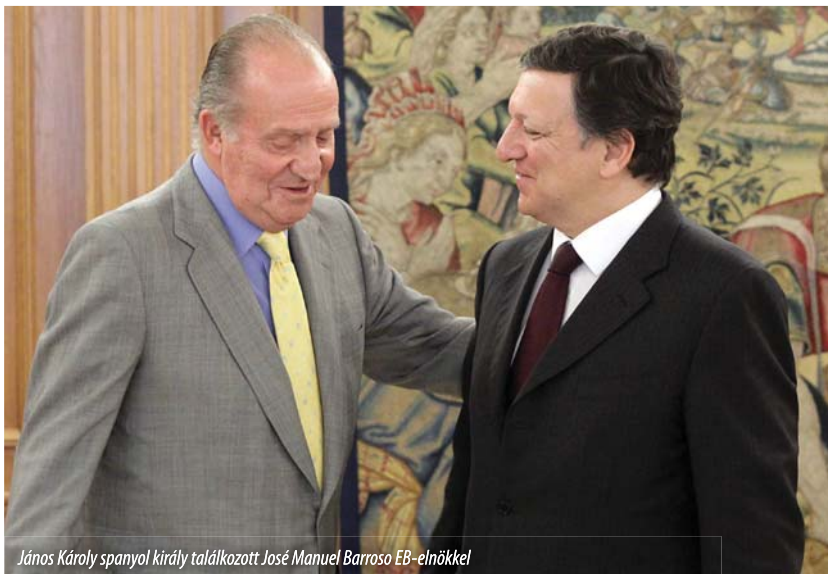
János Károly spanyol király találkozott José Manuel Barroso EB-elnökkel

Január 1-jétől, immár negyedszer, Spanyolország áll az Európai Unió Tanácsának élén. A lisszaboni szerződés tavaly decemberi hatályba lépése azonban jelentősen megváltoztatja az eddig megszokott félévenkénti elnökségi rendszert. Spanyolország lesz az első ország, amely az elnökségét az unió állandó elnöke és külügyi főképviselője mellett fogja végezni. Madrid továbbá Belgiummal és Magyarországgal együtt, ún. „trió-rendszerben” látja majd el feladatát.