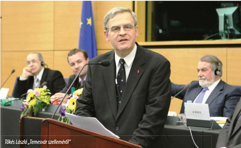
Tőkés László „Temesvár szelleméről”

„Megtiszteltetésnek és kiváltságnak érzem, hogy átvehetem a Robert Schuman-díjat, éppen ma, amikor a kegyetlen kommunista diktatúra romániai bukásának huszadik évfordulójára emlékezünk, arra, hogy a nép összefogása megdöntötte a rendszert.