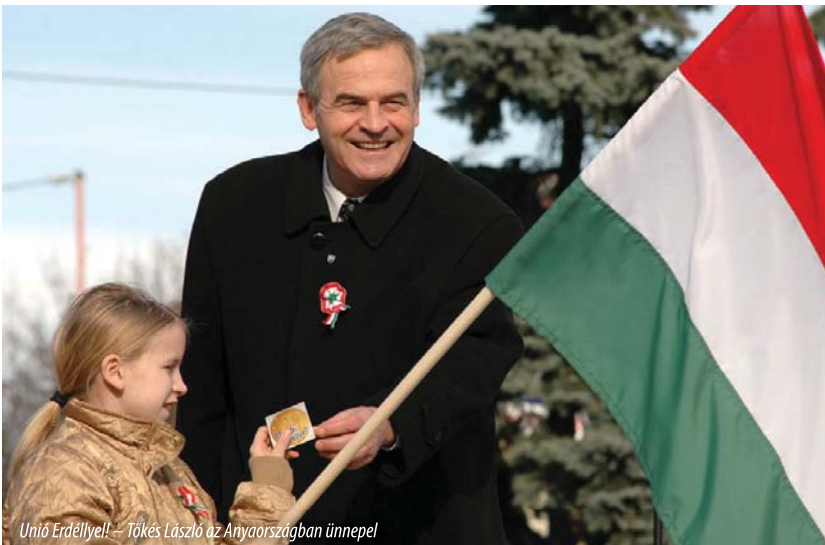
Unió Erdélyell – Tőkés László az Anyaországban ünnepel

Tőkés László szolgálata a nemzeti ünnepen