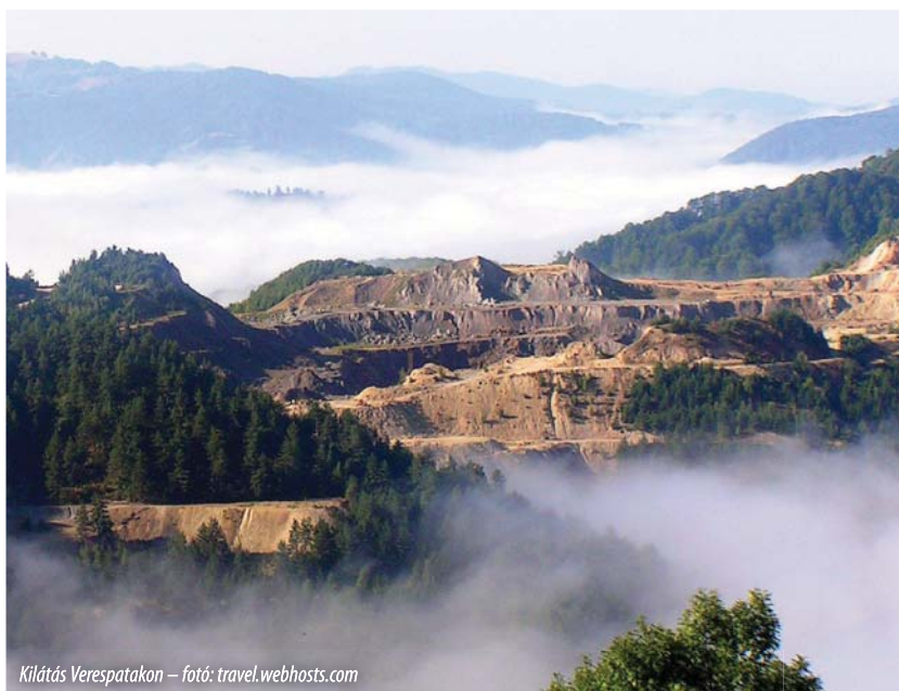
Kilátás Verespatakon

M. mivel két gramm arany előállításához egy tonna alacsony minőségű ércet kell kitermelni, ami után hatalmas mennyiségű bányászati hulladék marad a helyszíneken, miközben az arany 25–50%-a végül a hulladéklerakóban marad; mivel ráadásul a cianidos bányászati technológiát alkalmazó nagyszabású