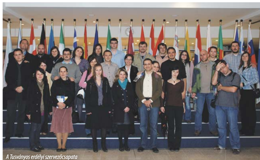
A Tusványos erdélyi szervezőcsapata