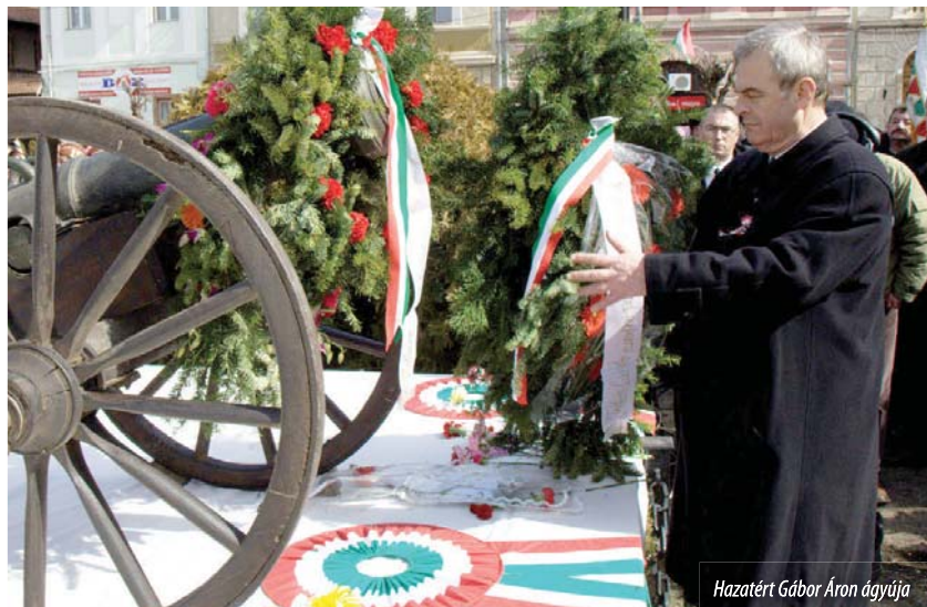
Hazatért Gábor Áron ágyúja