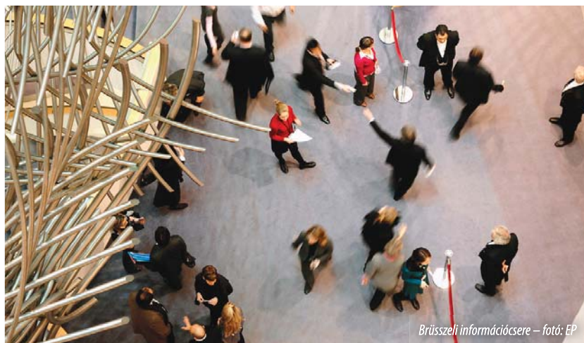
Brüsszeli információcsere

„... a tavaly szeptember 1-én életbe lépett nyelvtörvénynek kimutathatóan negatív hatásai vannak, a magyarok ugyanis lassan félnak használni a nyelvüket, nehogy megbüntessék őket. A negatív hatások természetesen a sajtóra is kihatnak ...”