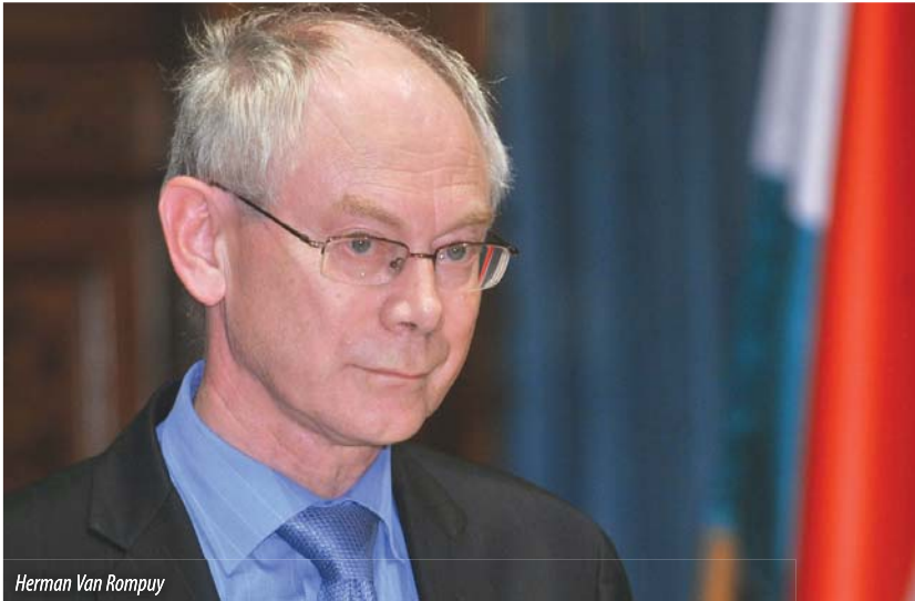
Herman Van Rompuy

Az Európai Parlament Néppárti Frakciójának 2010. március 3-i rendes ülése azáltal vált különlegessé, hogy azt – megválasztása óta első ízben – jelenlétével tisztelte meg Herman Van Rompuy , az Európai Tanács elnöke. Az ismerkedés céljából megrendezett eszmecsere kapcsán a Lisszaboni Szerződés révén létrehozott új tisztséget elsőként betöltő új elnök az Európai Unió intézményei és tisztségviselői közötti kapcsolattartás és együttműködés fontosságát, valamint saját, ez iránti elkötelezettségét hangsúlyozta.