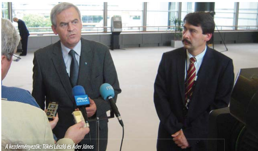
A kezdeményezők: Tökés László és Áder János

Az Európai Parlament plénumán, Brüsszelben 2010. május 5-én végszavazásra került sor a cianidos bányászati technológiák alkalmazásának tilalmáról szóló határozati állásfoglalási indítvány ügyében. Az Áder János és Tökés László európai képviselők által 2010 márciusában útjára indított kezdeményezés az Európai Néppárt hathatós támogatásának, valamint az EP-frakciók példás összefogásának köszönhetően 488 igen, 48 nem és 57 tartózkodó szavazattal jutott sikerre. A szavazati arányok, illetve az ellenszavazatok tízszerezését kitevő igenek (am. a leadott szavazatok 82%-a) meggyőzően szemléltetik az ügy európai súlyát és támogatottságát.