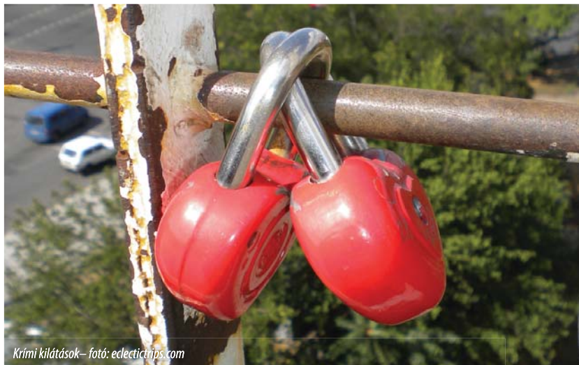
Krími kilátások

Szóbeli előterjesztésében Tőkés László rámutatott, hogy az EU Keleti Partnerségének országgyűjtésébe tartozó – volt szovjet – államok