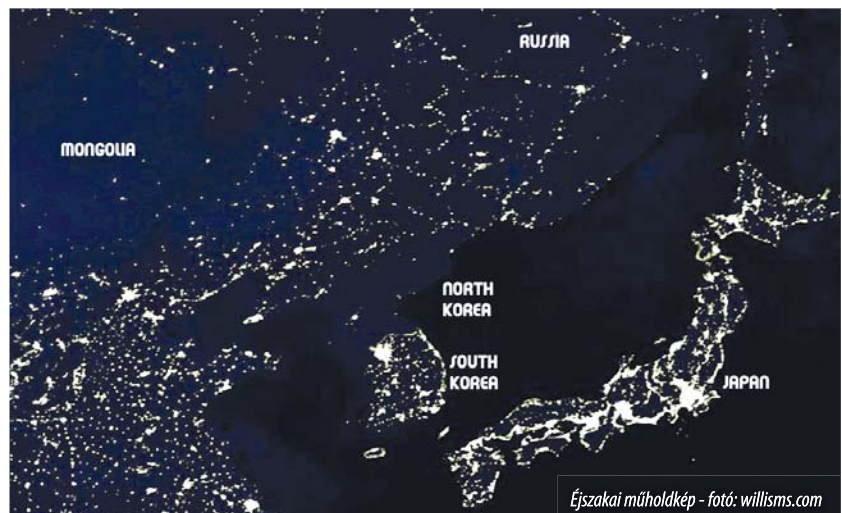
Éjszakai műholdkép

Dong-Hyuk Shin , egy észak-koreai fogolytábor egykori lakójaként drámai hitelességgel számolt be „társadalmi börtöntáborként” működő hazája sanyarú valóságáról. A fiatal előadó nyelvének részét maga is fogságban töltötte. 2005-ben abból a kényszermunka-táborból sikerült