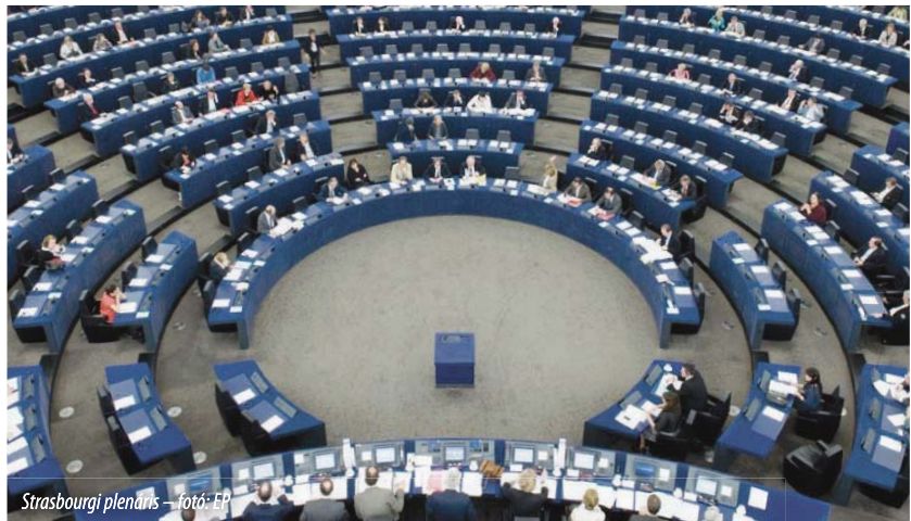
Strasbourgi plenáris – fotó: EP

Az EU-nak erősítenie kell stratégiai autonómiáját, az Európai Parlament-