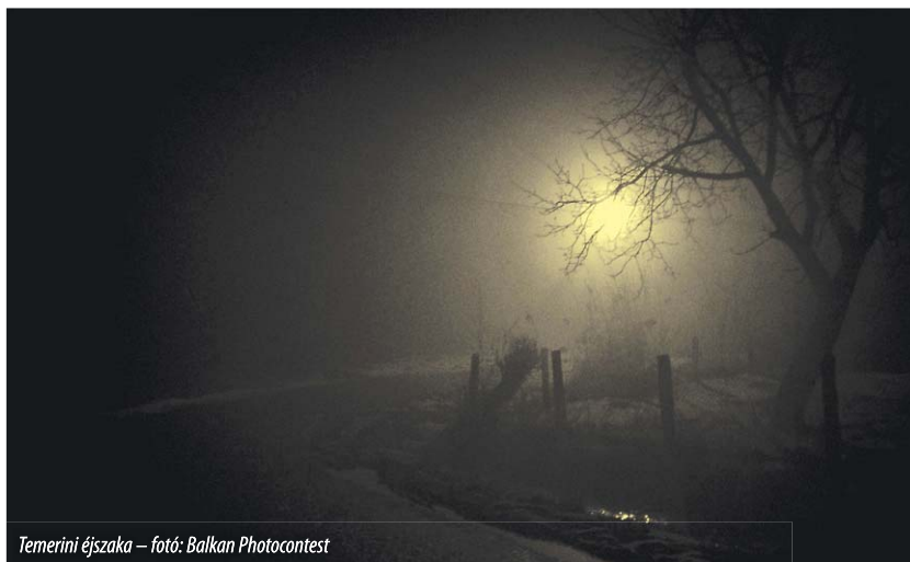
Temerini éjszaka

Ezen hosszan elhúzódó, mindmáig orvosolatlan ügy eseménynaptárába az is beletartozik, hogy múlt év márciusában, Becsey Zsolt akkori EP-képviselő kezdeményezésére, illetve Tőkés László szervezésében közmeghallgatást tartottak az Európai Parlamentben. A rendkívüli fellépést az tette szükségessé, hogy a 2004 januárjában Vajdaságban járt EP-tényfeltáró bizottság jelentése –