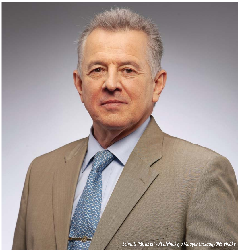
Schmitt Pál, az EP volt alelnöke, a Magyar Országgyűlés elnöke

„Az Európai Unió következő tízéves gazdasági stratégiájának reális és megvalósítható célokat kell kitűznie, és abban a tagállamok felzárkózását segítő kohéziós politikának is kiemelt