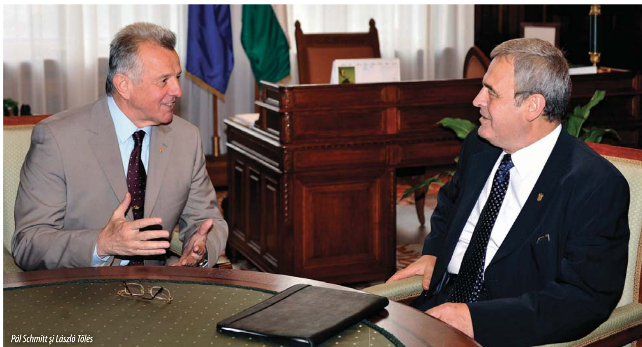
Pál Schmitt și László Tőkés

În data de 15 iunie, în cadrul ședinței plenare a PE de la Strasbourg László Tőkés a fost ales cu 334 de voturi pentru, respectiv 287 de abțineri și voturi împotriva în funcția de vicepreședinte al Parlamentului European. Nominalizarea a fost făcută de către delegația maghiară a Partidului Popular European în data de 9 iunie 2010, și a fost sprijinită și de delegația română din cadrul PPE, respectiv de întreaga fracțiune PPE a Parlamentului European. Postul a rămas vacant după ce europarlamentarul FIDESZ, Schmitt Pál , primul vicepreședinte maghiar al PE, a demisionat din funcție după ce în urma alegerilor generale din Ungaria a ajuns președinte al Parlamentului Ungariei. Social-democrații și liberalii români din Parlamentul European și din Parlamentul României – recurând la retorică extremistă – au