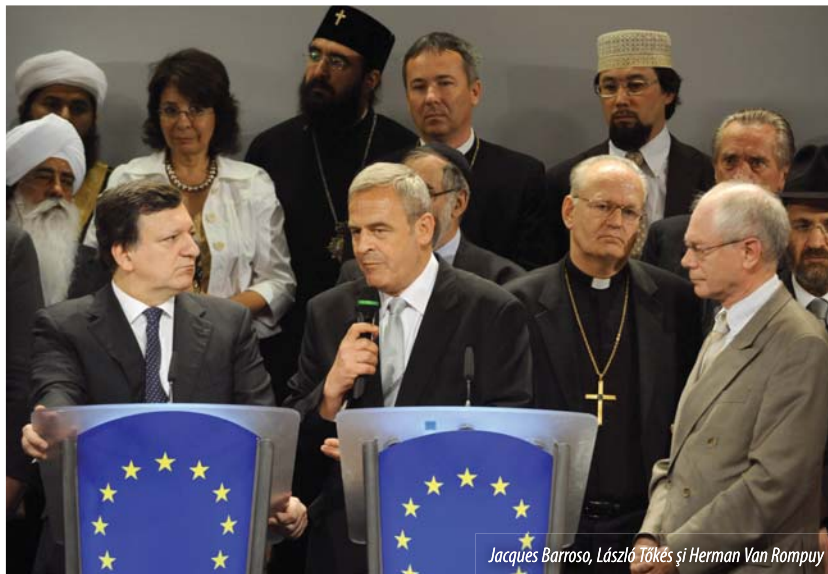
Jacques Barroso, László Tőkés și Herman Van Rompuy

Se poate considera și un prim moment al dialogului instituționalizat faptul că în 18 noiembrie participanții la reuniune au fost primiți la Bruxelles de către Pál Schmitt, vicepreședinte al PE (responsabil