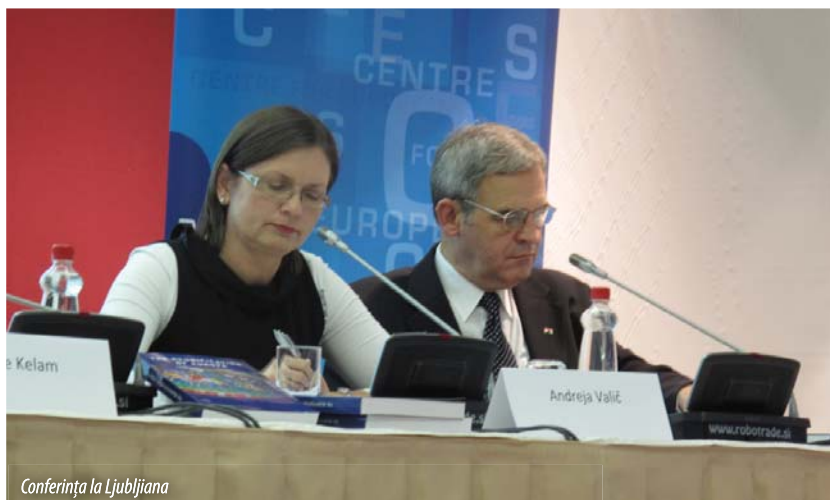
Conferința la Ljubljana

În zilele de 26-27 noiembrie și la Ljubljana s-a comemorat a 20-a aniversare a schimbărilor de regim din Europa Centrală și de Est, în cadrul unei conferințe organizate de Institutul Jože Pučnik. „Comemorările susținute cu ocazia celei de-a 20-a aniversări, deci și conferința de la Ljubljana, au în primul rând rolul și menirea de a susține rupea noastră definitivă de moștenirea comunismului, precum și împlinirea schimbării de regim care a început în 1989” – a formulat eurodeputatul László Tőkés, în cuvântarea sa din cea de-a doua zi a conferinței.