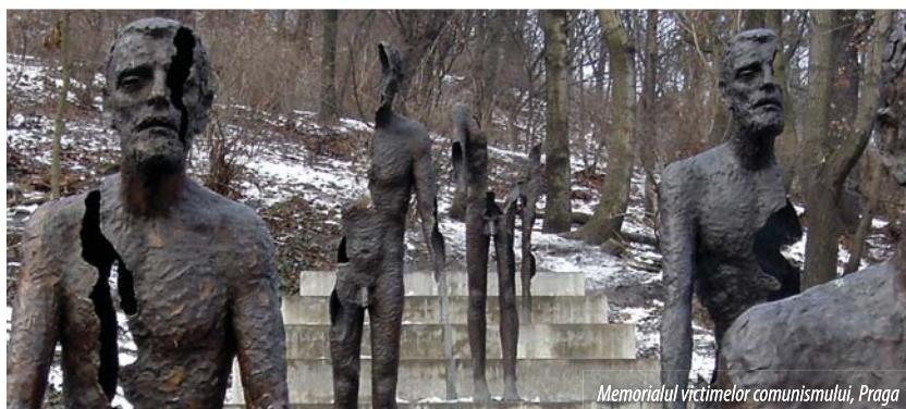
Memorialul victimelor comunismului, Praga

Aniversarea de 20 de ani a prăbușirii regimului comunist în fostul bloc sovietic a fost marcată de o serie de comemorări, conferințe, expoziții etc. internaționale și naționale în multe orașe europene. Ne este imposibil să vă oferim o relatare completă și detaliată despre toate aceste evenimente, dar încercăm, prin materialele strânse laolaltă, să evocăm câteva din aceste momente și să transmitem mesajul lor.