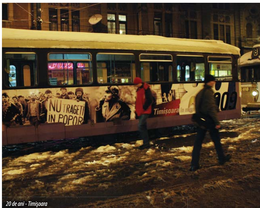
20 de ani - Timișoara

În sediul de la Bruxelles al Fundației Konrad Adenauer în data de 27 ianuarie 2010 a avut loc o comemorare al cărei invitat de onoare a fost eurodeputatul László Tőkés. Președintele celei mai puternice fundații politice din Germania este Hans-Gert Poettering, fostul președinte al Parlamentului European.