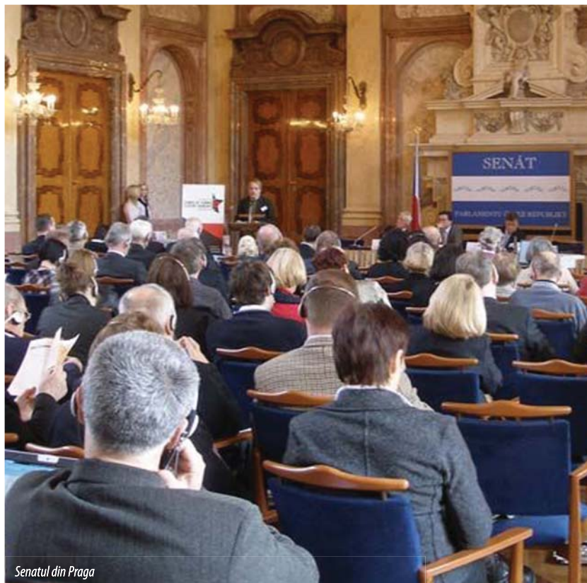
Senatul din Praga

7. Având în vedere că democrația trebuie să învețe să fie capabilă să se apere singură, ea însăși, comunismul trebuie condamnat în mod similar cu modul în care a fost