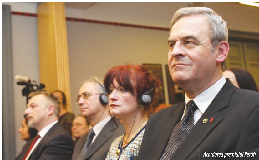
Acordarea premiului Petőfi

Terror House Budapesta, 17 decembrie 2009