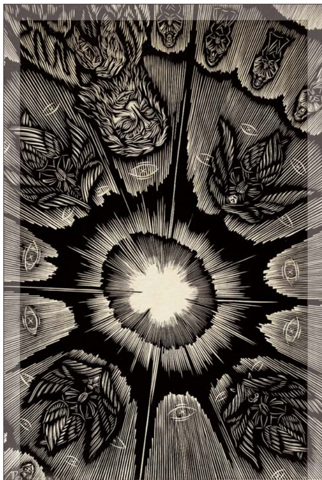
Gy. Szabó Béla: Cartea Apocalipsei: Aleșii

„Și Cuvântul a devenit trup și a locuit printre noi” – ne vestește Aposotul Ioan (Ioan. 1.14). Din adâncul Sfintei Scripturi se va întruchipa și ni se va înfățișa Hristos Mântuitorul și va veni la ai Săi să umble și să sălășluiască printre ei, să-i ferească, să-i mântuiască. Să-L primim în inimile noastre, în bisericile și căminele noastre, ca El să ne binecuvânteze în dragoste sărbătoarea și întreaga noastră viață!