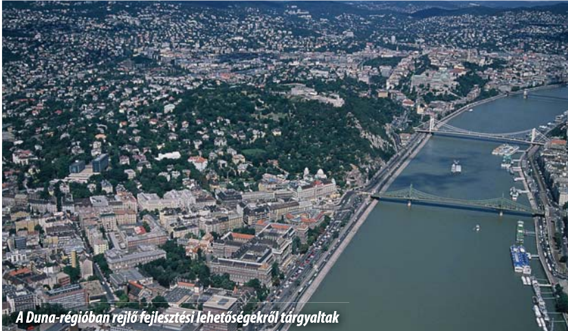
A Duna-régióban rejlő fejlesztési lehetőségekről tárgyaltak

Deutsch Tamás fideszes EP-képviselő a Duna-régióban rejlő fejlesztési lehetőségekre, valamint a turizmusfejlesztés és a környezetvédelem összefüggéseire hívta fel a figyelmet a szeptember 27-én megrendezett „Turizmus a Duna-régióban” című konferencián. Az esemény aktualitását az Európai Turizmus Napja és a Duna-stratégia közelmúltbeli elindítása adta.