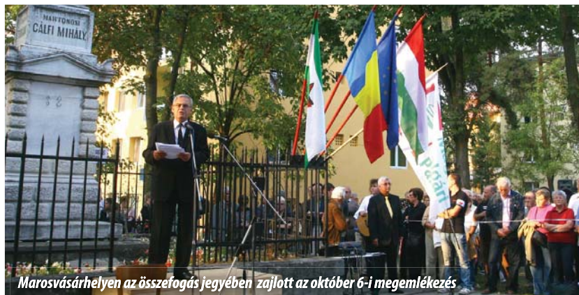
Marosvásárhelyen az összefogás jegyében zajlott az október 6-i megemlékezés