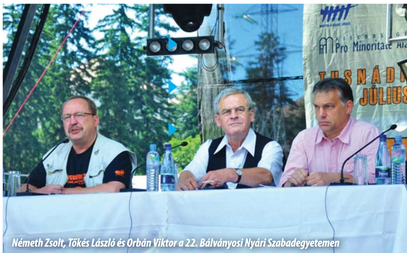
Németh Zsolt, Tőkés László és Orbán Viktor a 22. Bálványosi Nyári Szabadegyetemen

Tőkés László bevezetéképpen a kilencven évvel ezelőtt írott Kiáltó szó szellemiségét idézte meg, mondván, hogy a röpirat erdélyi magyarságunkra vonatkozó tartalma ma is érvényes. A sebtépés, önsajnálata ideje lejárt, a továbbhaladás útját pedig a szabadság, az egyesülés és a gyógyulás kulcsszavak mutatják. Ezek közül az első a magyar állampolgárság kiterjesztését, a második „Trianon gyógyítását”, a harmadik pedig a hűsvéti alkotmányt jelenti – hangzott el. Az egykori temesvári református lelképásztor a mai romániai helyzetre kitérve rávilágított arra, hogy két évtized alatt keveset sikerült megvalósítania az erdélyi magyarságnak. 1920 óta nem volt becsületes népszámlálás, felemelkedés helyett elburjázott a korrupció. Az európai és a világméretű válságot tetézi az erkölcsi válság. „Nem volt időnk szembenézni a kommunista múlttal. Se autonómiánk, se államilag finanszírozott magyar egyetemünk nincsen. Kikínlódtunk egy magánegyetemi rendszert, épp az első Orbán-kormány jóvoltából” – hangzott. Hozzáfűzte: még mindig a posztkommunizmus terhével viaskodunk, és ehhez hozzájárul még a szórványosodás, a népességfogyás, vagy a román magyarellenesség