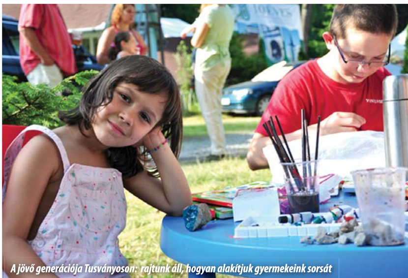
A jövő generációja Tusványoson: rajtunk áll, hogyan alakítjuk gyermekeink sorsát

ja nemzetpolitikájának kereteit és koordinátáit. És akkor azt mondja erre Orbán Viktor , hogy a nemzetietlen baloldal időről időre ráront a nemzetére, és sajnos ez így is van. Nemrégén még Mesterházy és Victor Ponta írtak alá valami közös nyilatkozatot a szocialisták nevében, talán Brüsszelben, az új magyar törvényekkel kapcsolatban. Hol vagyunk, Uraim és Hölgyeim? És akkor a román nacionalizmus és nacionálkommunizmus is időről időre ráront magyar nemzetiségű polgáira, s Cohn-Bendit és Martin Schulz még segédcapatokat küldenek ennek a fajta posztkommunista nacionalizmusnak; a magyarellenesség hagyományait éltetik és segítik éltetni. Ráront a magyarságra a területszerző, térhódító többségi nacionalizmus Szlovákiában és Romániában, hogy a magyarverésekről most ne beszéljék, és a továbbélő nacionálkommunizmus az erdélyi és felvidéki magyarokra. Íme, területi átszervezéssel lepnek meg bennünket, például tavalyi vendégünk, Traian Băsescu és a többségi kormánypárt az európai regionalizáció ürügye és örve alatt – és ennek a kormánynak a tagja a Magyar Demokrata Szövetség. Nesze neked, térségfejlesztés, nesze neked, székely régió! Szlovákiában már véghezvitték a közigazgatási és egyház-közigazgatási területátrendezést, és szinte zokszó nélkül aszisztáltunk hozzá, most azt várjuk, hogy itt is hasonló átszervezéseket vigyenek végbe? Természetesen, a kérdés költői. Ebben a tekintetben nincs helye alkunak. Ez az üres hely