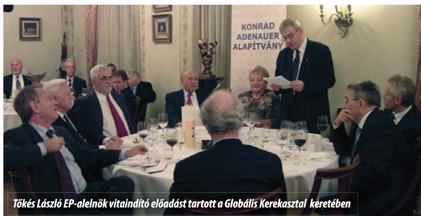
Tőkés László EP-alelnök vitaindító előadást tartott a Globális Kerekasztal keretében