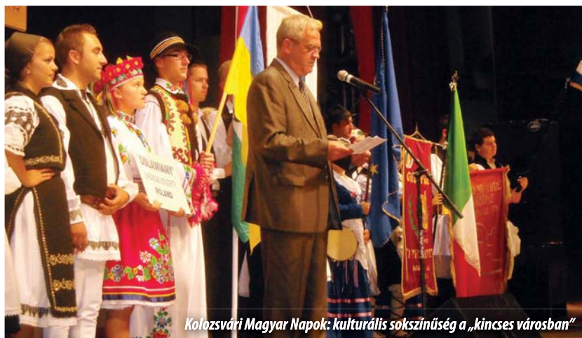
Kolozsvári Magyar Napok: kulturális sokszínűség a „kincses városban”