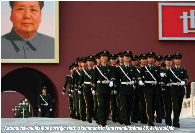
Katonai felvonulás Mao portréja előtt, a kommunista Kína fennállásának 60. évfordulóján

sai szinte teljességgel hatástalanok maradnak. Tibet és Hszincsiang tartomány vonatkozásában a kínai tárgyalófél a megszokott kommunista kirakatpolitika hamis érvelésével vetett vissza valamennyi, tényekre alapozott kritikát.