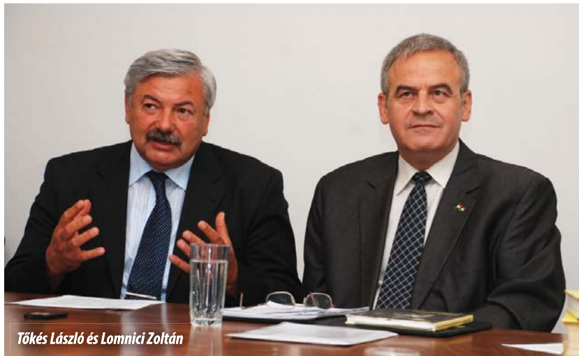
Tőkés László és Lomnici Zoltán