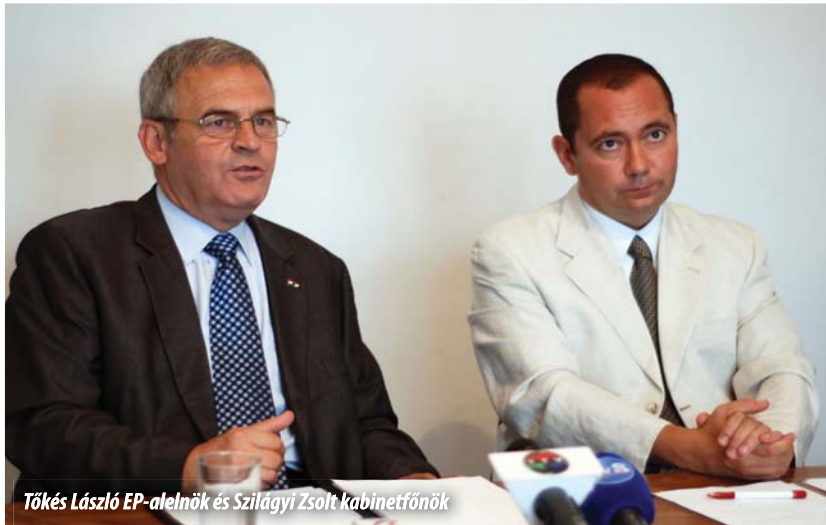
Tőkés László EP-alelnök és Szilágyi Zsolt kabinetfőnök

Az Európai Parlamentben kezdődő őszi ülészakapropóján összehívott szeptember 2-i sajtóértekezleten Tőkés László EP-alelnök kabinetfőnöke, Szilágyi Zsolt társaságában tekintett vissza eddigi parlamenti tevékenységére. Szilágyi Zsolt emlékeztetésképpen elmondta: az Erdélyi Magyar Nemzeti Tanács elnökeként mandátumot nyert Tőkés László EP-képviselő egyszerre tagja az Európai Parlament román és magyar néppárti delegációjának, a magyar és a román küldöttségnek. A kulturális és a külügyi szakbizottságokon kívül az Emberi Jogi Bizottság tagjaként is tevékenykedik, mint képviselő, de alelnökké választása óta, Schmitt Pál portfólióját megörökölve, egyaránt felel a kultúráért, az egyházi és vallási felekezetekkel való párbeszédért, a Keleti Partnerségért, valamint a nyugat-balkáni bővítésért.