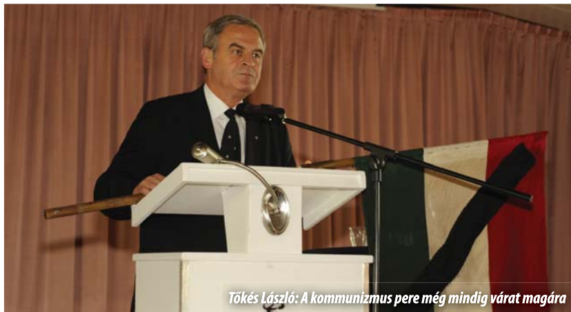
Tőkés László: A kommunizmus pere még mindig várta magára

A hangszeres zenével, népdalok éneklésével, magyar népi táncokkal tarkított délutáni ünnepség keretében az éppen 1956-ban született Jan Pieter Balkenende volt kormányfő hollandul elhangzott beszédéből ►