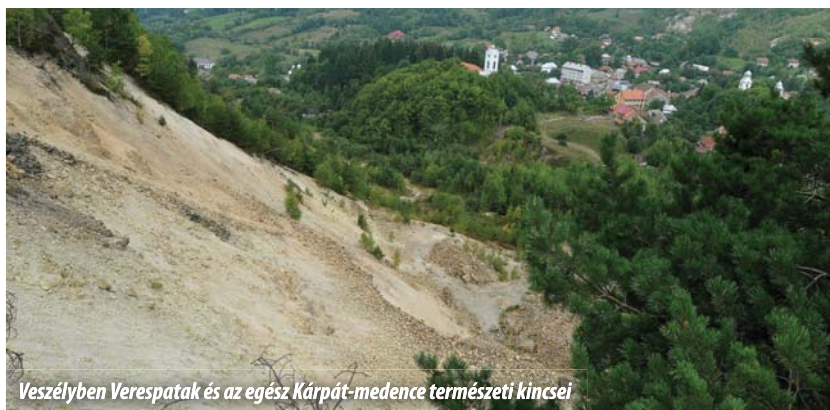
Veszelyben Verespatak és az egész Kárpát-medence természeti kincsei

Emlékezetes, hogy tavaly májusban az Európai Parlament elsöpör többséggel szavazta meg azt a határozatot, mely a ciánalapú bányászat általános tilalmának elrendelését indítványozta az Európai Bizottságnál. Az Áder János és Tőkés László európai képviselők kezdeményezésére született határozat azonban nem bír kötelező erővel a