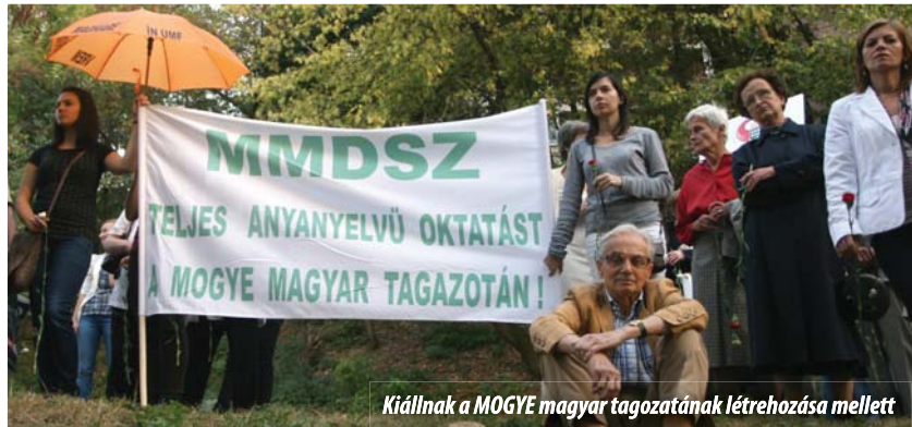
Kiállnak a MOGYE magyar tagozatának létrehozása mellett

Tőkés László az újságírók kérdésére válaszolva elmondta: nem kíván funkciót vállalni az újonnan bejegyzett pártban. Az EMNT elnöke állást foglalt a mozgalom olyan, alulról építkező hálózatának a kialakítása mellett, amely a magyarokat kérdezi meg, hogy mit szeretnének, nem felülről mondván meg, hogy mi