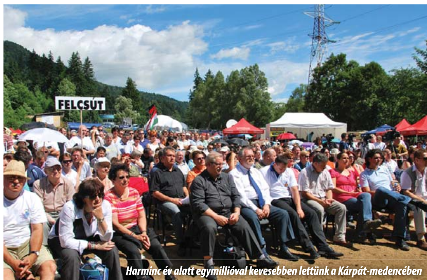
Harminc év alatt egymillióval kevesebben lettünk a Kárpát-medencében

Nos, csak vázolni tudom azt az állapotot, mely ráköszönt az új nemzeti kormányra, és mely megszab-