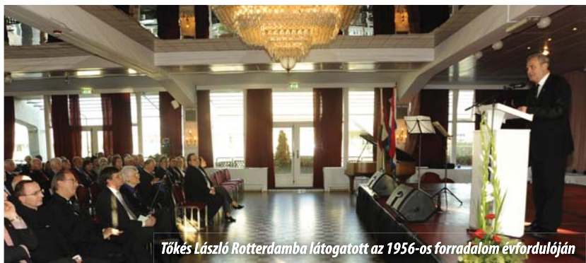
Tókes László Rotterdamba látogatott az 1956-os forradalom évfordulóján