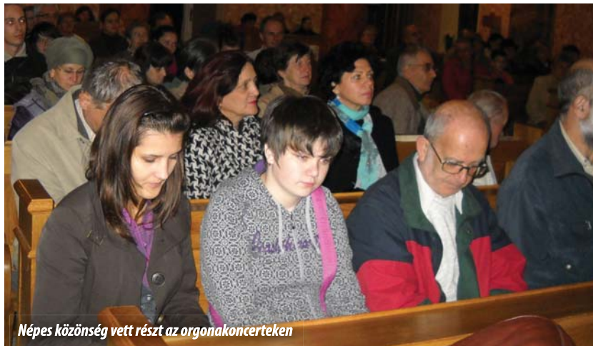
Népes közönség vett részt az orgonakoncerteken