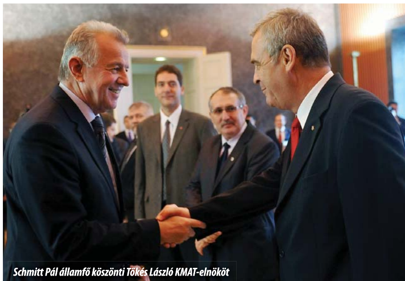
Schmitt Pál államfő köszönti Tökés László KMAT-elnököt

Mint mondta, államfőként az a munkája, hogy „puhítsa” a szomszédos országok államfőit, így az elmúlt egy évben minden szomszéd-