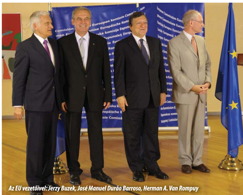
Az EU vezetőivel: Jerzy Buzek, José Manuel Durão Barroso, Herman A. Van Rompuy