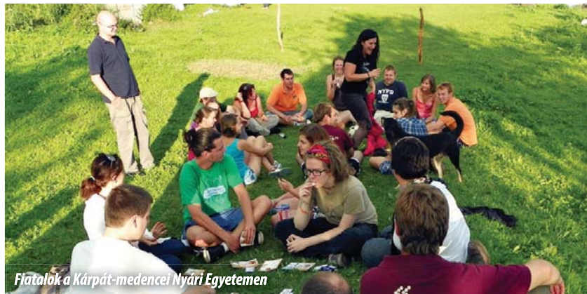
Fiatalok a Kárpát-medencei Nyári Egyetemen

Beszédének utolsó részében Tőkés László Verespatak épített és természeti értékeinek a megóvására szól, annak apropóján, hogy a Kárpát-medencei Nyári Egyetem résztvevői a hét folyamán látogatást tettek az ősi aranybányász településen. Az EMNT elnöke kifejtette: „Félő, hogy a kulisszák mögött bizonyos erők már megkötötték a boltjait, beleértve az illetékes romániai minisztériumi szaktárcák magyar minisztereit is.” Felhívta a figyelmet arra, hogy egy Európa-ellenes és korrupció-gyanús törekvéssel állunk szemben, melynek mozgatói az