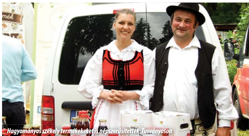
Hagyományos székely termékeket is népszerűsítettek Tusványoson

Nos, a szabadságharc, a nemzetegyesítés és a nemzet gyógyításának hármas összefüggésében indítom beszédemet, arra is emlékeztetve, hogy 2007-ben, az európai parlamenti választásokon jelszavunk ez volt: Unió, Erdéllyel! 2009-ben jelszavunk így szólt: „Magyar unió az Európai Unióban”. Trianon 90. évfordulójának ez volt a központi gondolata: „Trianon gyógyítása”. Azt a miniszterelnököt, a Nemzet Miniszterelnökét köszöntöm mindnyájatokkal együtt, aki szabadságharcaink szellemében, 1989. június 16-án elsőként mondta ki, hogy a megszálló szovjet csapatok menjenek haza. Azóta az ifjú demokraták a középnevezdek sorába léptek elő, amint az elnökség összetételéből is látszik, de itt van Pozsgay Imre , a megelőző korszaknak az úttörő képviselője, aki a megboldogult Habsburg Ottó val együtt éppen abban az időszakban volt védnöke a Páneurópai Pikniknek. Milyen fer-