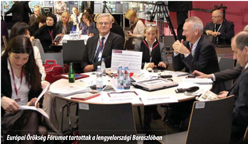
Európai Örökség Fórumot tartottak a lengyelországi Boroszlóban

A lengyelországi Boroszlóban 2011. szeptember 10-én és 11-én tartották meg az Európai Örökség Fórumot , amelyen Jerzy Buzek EP-elnök megbízásából Tőkés László , az Európai Parlament kulturális ügyekért felelős alelnöke is részt vett.