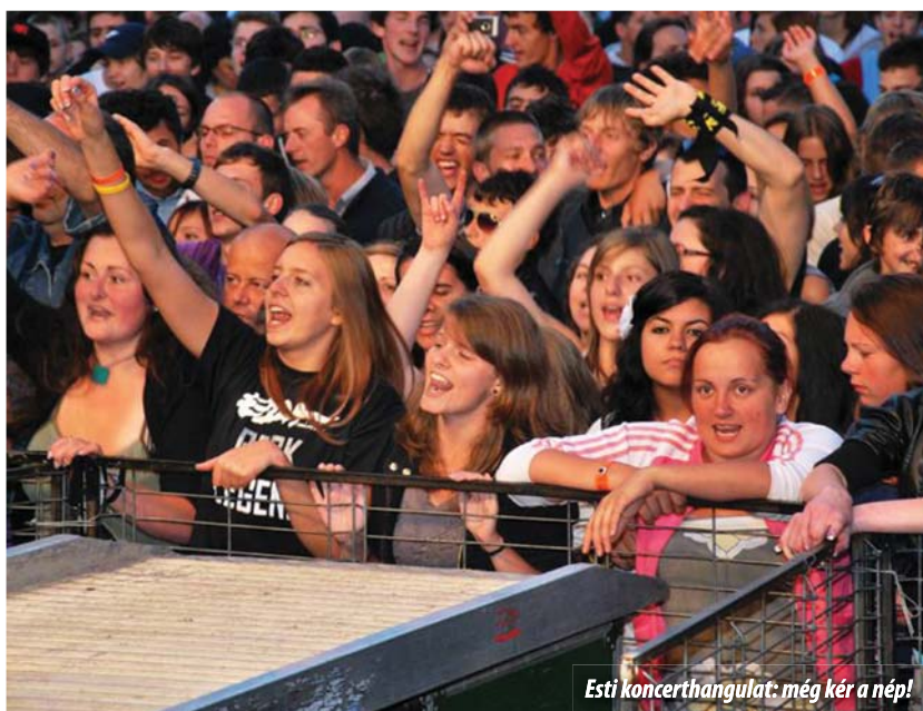
Esti koncerthangulat: még kér a nép!