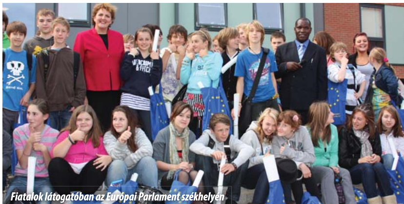
Fiatalok látogatóban az Európai Parlament székhelyén.

Az Európai Parlament Oktatási és Kulturális Bizottságának (CULT) 2011. július 13-i ülésén mutatkoztak be a soros lengyel EU-elnökség illetékes miniszterei és számoltak be a szaktárcák által meghatározott el-