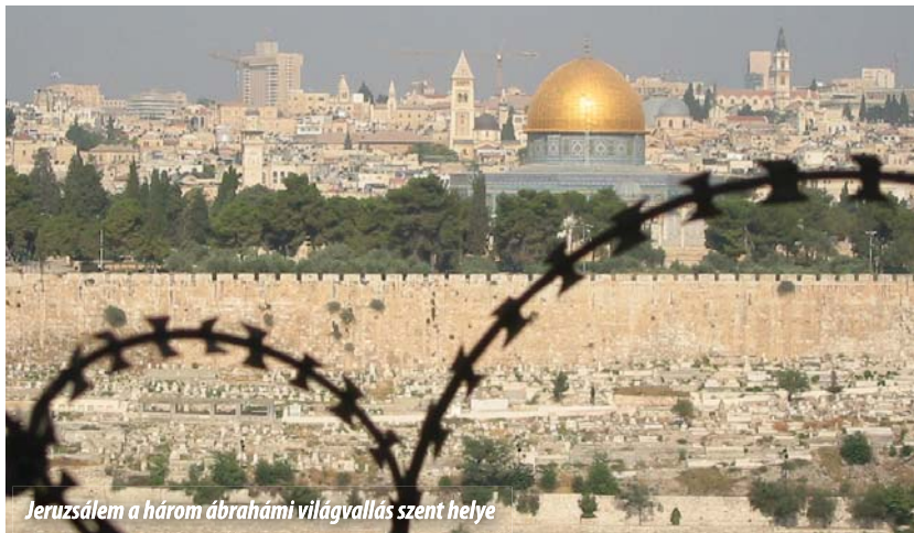
Jeruzsálem a három ábrahám világvallás szent helye

A valamikor még „ősellenségeknek” számító anglikán és brit katolikus egyházak első számú vezetőinek, William Rowan canterbury, valamint Vincent Nichols westminsteri érsekeknek a szervezésében és irányításával került sor 2011. július 18–19-én, Londonban a szentföldi keresztények ügyével foglalkozó nemzetközi konferenciára. A szervező egyházak jelképes értékű összefogása, valamint a keresztény, zsidó és muszlim, másfelől az egyházi, a politikai és a civil szférát képviselő meghívottak és résztvevők mintaszerű együttműködése kiváló példáját nyújtja az építő párbeszéd alapuló konfliktuskezelésnek és problémamegoldásnak. Ezt a törekvést és szemléletmódot a konferencia programja is híven tükrözi. A két magas egyházi méltóság megnyitóbeszédeit követően, a Szentföld képviseletében a szintén katolikus és anglikán Fouad Twal pátriárka, valamint Suheil Dawani jeruzsálemi püspök tartottak általános helyzetismertetőt, ennek nyomán pedig a tárgyban leginkább érintett palesztin keresztény közösség néhány fiatal képviselője nyújtott a mindennapi életükről és helyzetükről szóló hiteles élménybeszámolót. Izraelből, illetve Palesztinából való zsidó és muszlim előadók a közös megoldáskeresés jegyében, a saját szemszögükből nézve egészítették ki azt az általános képet, mely egészében véve a kétszeresen kisebbségi helyzetben élő palesztin keresztények többszörösen hátrányos megkülönböztetéséről, az egymás