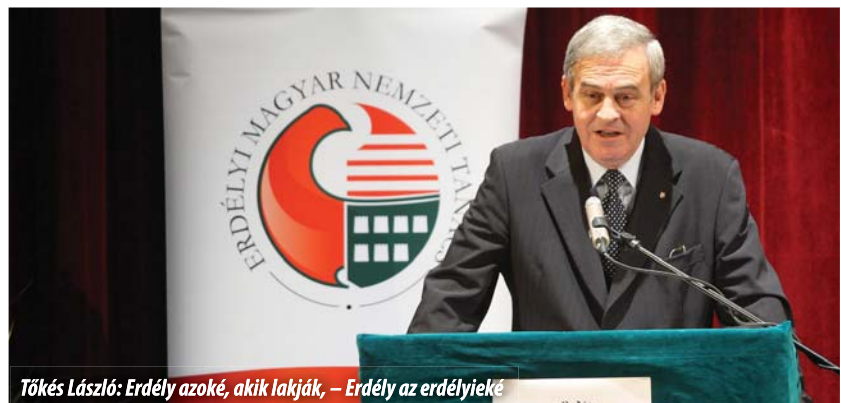
Tőkés László: Erdély azoké, akik lakják, – Erdély az erdélyieké

Tőkés László az Erdélyi Magyar Néppárt védnöke