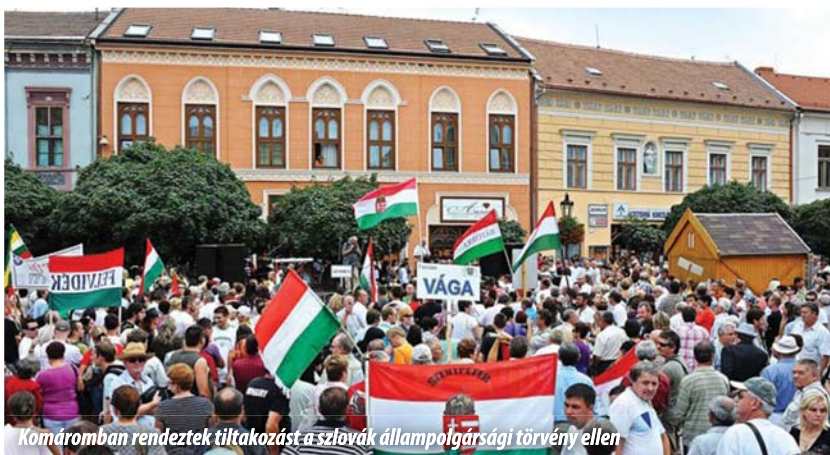
Komáromban rendeztek tiltakozást a szlovák állampolgársági törvény ellen

Berényi Józsefet fogadta az Európai Parlament szeptemberi plenáris ülésén a Gál Kinga vezette Kisebbségi Munkacsoport. A Magyar Koalíció Pártjának (MKP) elnöke a felvidéki magyarság helyzetét és a szlovák kormányzat kisebbségekhez való hozzáállását európai kisebbségvédelmi összefüggésbe helyezve ismertette az EP-képviselőknek. Az érdekesítő beszámoló után, az ülés számos résztvevője elfogadhatatlannak tartotta az uniós polgárokkal szembeni nyelvi és állampolgárság szerinti hátrányos megkülönböztetést.