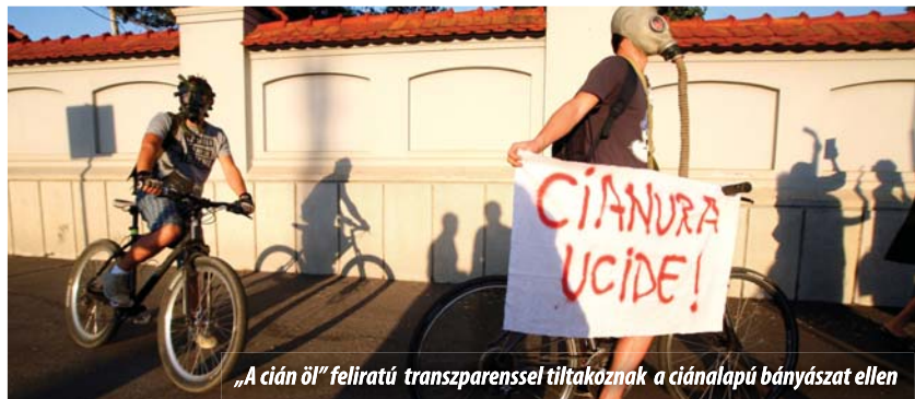
„A cián öl” feliratú transzparenszel tiltakoznak a ciánalapú bányászati ellen

Emlékeztet, hogy a múlt év tavaszán, Áder János és Tőkés László képviselők indítványa alapján az Európai Parlament határozati állásfoglalásban szólította fel az Európai Bizottságot a ciánalapú bányászati technológiák teljes betiltására az Európai Unió területén. Az elsőprő szavazati többséggel elfogadott határozat foganatosítását azonban a Bizottság egyre halogatja, szabad utat engedve ezáltal a 2000 elején bekövetkezett tiszai ciánseren-csétlenséghez hasonló környezeti katasztrófa veszélyét hordozó verespataki bányaberuházás megvalósításának.