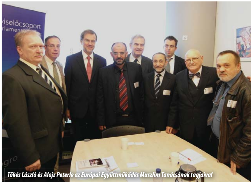
Tőkés László és Alojz Peterle az Európai Együttműködés Muszlim Tanácsának tagjaival

Az Európai Parlament brüsszeli székhelyén Tőkés László vallási ügyekért felelős alelnök európai iszlám vezetőekkel, az Európai Együttműködés Muszlim Tanácsának (Muslim Council for Cooperation in Europe-MCCE) képviselőivel találkozott 2011. október 18-án.