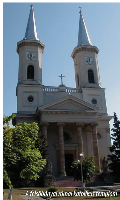
A felsőbányai római katolikus templom