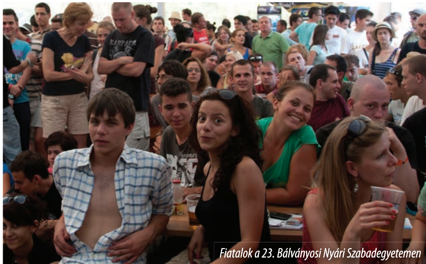
Fiatalok a 23. Bálványosi Nyári Szabadegyetemen

Az olimpiai játékok harmadik üzenete számomra a csapatjáték fontossága. Amint az köztudott, a csapatsportok elsőbbséget élveznek a magyar kormány programjában. Orbán Viktor maga is, mint a Puskás Ferenc Akadémia alapítója és a magyar sport elkötelezett támogatója – politikai társaival egyetemben – hirdette meg ezt. A FIDESZ -hez igazán talál ez a sportpolitika. Nemrégben, a Bratislava-Videoton meccsen Orbán Viktor együtt vett részt Robert Ficovál . Lám, a „sportdiplomáciában” hogyan lehet felülemelkedni a nézetkülönbségeken. ►