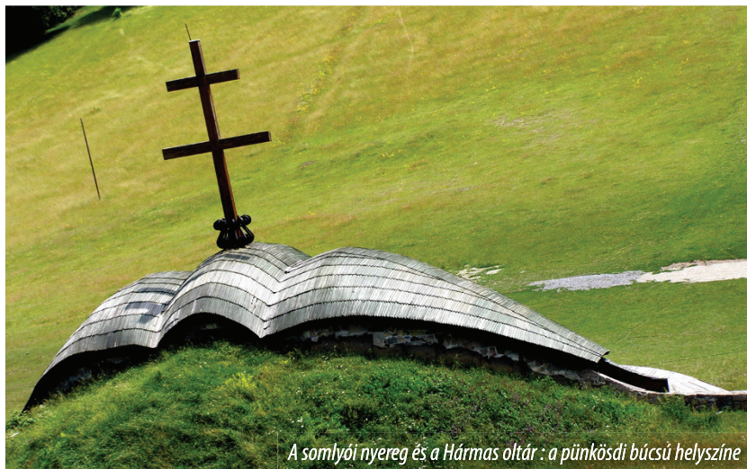
A somlyói nyereg és a Hármaskút: a pünkösdi búcsú helyszíne