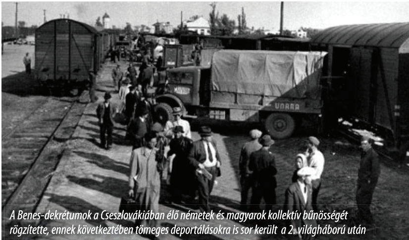
A Benes-dekrétumok a Csehszlovákiában élő németek és magyarok kollektív bűnösségét rögzítette, ennek következtében tömeges deportálásokra is sor került a 2. világháború után