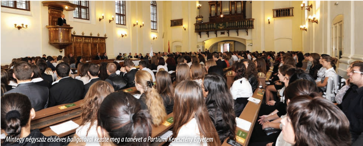
Mintegy négyszáz elsőéves hallgatóval kezdte meg a tanévet a Partiumi Keresztény Egyetem

2012. szeptember 28-án, a nagyváradi-újvárosi református templomban tartotta tanévnyitó ünnepségét a Partiumi Keresztény Egyetem . Az intézmény keresztény szellemiségéhez híven, a tanévet istentisztelettel nyitották meg. Igét hirdetett Tókécs László püspök, európai parlamenti képviselő, az egyetem elnöke. Máté evangéliumának néhány igeszakasza alapján az igehirdető olyan üzeneteket fogalmazott meg, melyek útravalóul szolgálhatnak az egyetemi hallgatók számára az új tanévben. Rámutatott arra, hogy Krisztus megkísértésének tanulságai megoldást kínálnak az elhatalmasodott gazdasági válság vagy a társadalomban jelen levő igazságtalanságok okozta aggodalmakra. „Nem csak kenyérrel él az ember” – áll az igében, amely az isteni értékekre irányítja figyelmünket. Tókécs László arra bízta az egyetemi hallgatókat, hogy emelkedjenek felül a világra jellemző „vulgáris materializmuson”, és ne csak a személyes boldogulás vágya hajtja őket, hanem az igazság szeretete, és közösségért való tenni akarás. „A legjobb nyugati fizetés sem kárpótolja a családjaink, szereteteink vagy szülőföldünk hiányát” – emlékeztetett az igehirdető, itthon maradásra buzdítva a fiatalokat. Végezetül azt kívánta az elsőéves hallgatóknak, hogy az egyetemen töltött idő ne csak az információ-szerzésről szóljon, hanem legyen felkészülés erdélyi magyar közösségünk elkötelezett szolgáltára.