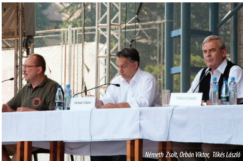
Németh Zsolt, Orbán Viktor, Tőkés László