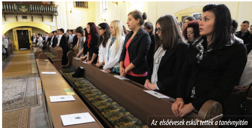
Az elsőévesek esküt tettek a tanévnyitón