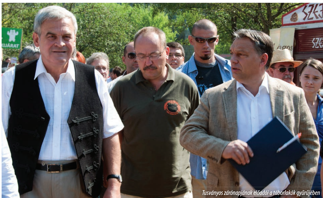
Tusványos zárónapjának előadói a táborlakók gyűrűjében