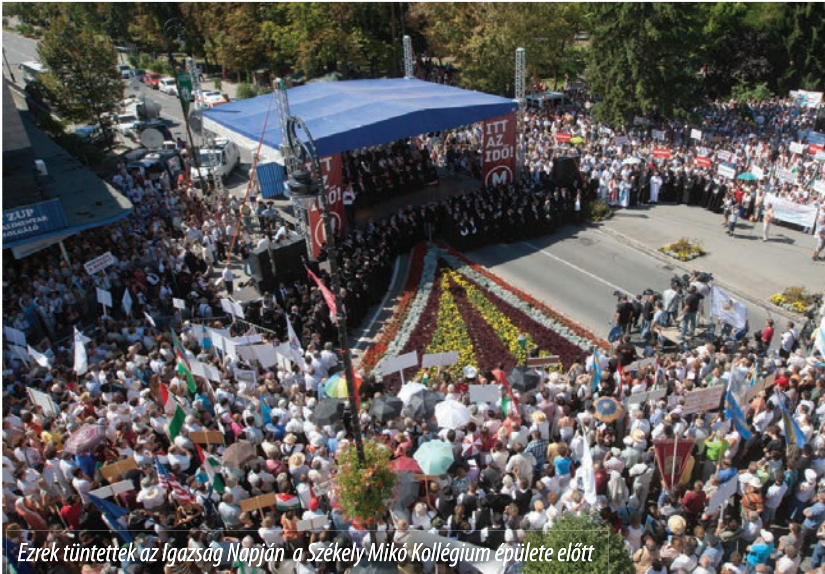
Ezrek tüntettek az Igazság Napján a Székely Mikó Kollégium épülete előtt

Az erdélyi magyarok hallgattak a magyar történelmi egyházak, civil szervezetek és politikai pártok hívó szavára, és részt vettek a Székely Mikó Kollégium visszaállamosítása és a restitúciós bizottság tagjainak börtönbüntetése ellen szervezett tiltakozáson, 2012. szeptember elsején, Sepsiszentgyörgyön.