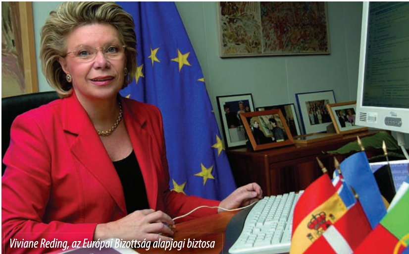
Viviane Reding, az Európai Bizottság alapjogi biztosa

Mint ismeretes, 2012. június 10-én Tőkés László EP-képviselő levélben kereste meg Viviane Redinget , az Európai Bizottság alapjogi biztosát a Székely Mikó Kollégium botrányos visszaállamosítása és a restitúciós bizottság szabadságvesztésre ítélt tagjainak az ügyében. Levelében ugyanakkor felhívta a figyelmet arra, hogy miközben erdélyi magyar történelmi egyházaink a kommunizmus idején jogtalanul elorzott tulajdonaikért küzdenek, addig az ortodox egyház privilegizált helyzetben van. Képviselőnk azt kérte Reding asszonytól, hogy kövesse nyomon a romániai a restitúciós folyamat akadályozásából fakadó igazságtalanságokat és kiemelten a Mikó-ügyet,