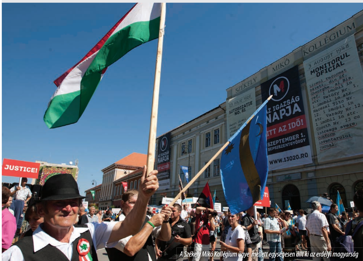
A Székely Mikó Kollégium ügye mellett egységesen állt ki az erdélyi magyarság

Tókes László európai képviselő, EMNT-elnök