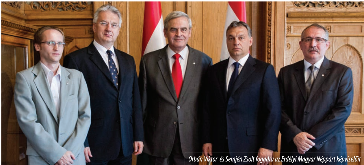
Orbán Viktor és Semjén Zsolt fogadta az Erdélyi Magyar Néppárt képviselőit

Az Erdélyi Magyar Néppárt Orbán Viktor miniszterelnökkel való hét eleji találkozásánál, a 2012. június 10-i helyhatósági választások kiértékelése rendjén Tőkés László európai parlamenti képviselő rámutatott: az RMDSZ fölényes választási eredményei (86%) megtévesztőek, amennyiben azt vesszük figyelembe, hogy az önmagát és kudarcos politikáját többszörösen túlélte érdekszövetség sikeres szereplése mögött milyen okok állanak. Egyszerűen arról van szó – mondotta erdélyi képviselőnk –, hogy a magyar közösség politikai képviseletét kiszorító és hatalmát egypárti kizárólagossággal gyakorló RMDSZ-t éppen olyan nehéz leváltani, mint a Fidesz-KDNP 2010-béli választási győzelme. Kellő összefogás, munka és felkészülés nyomán ennek megvalósítására nyílt lehetőség a 2016-os helyi és országos választásokon.