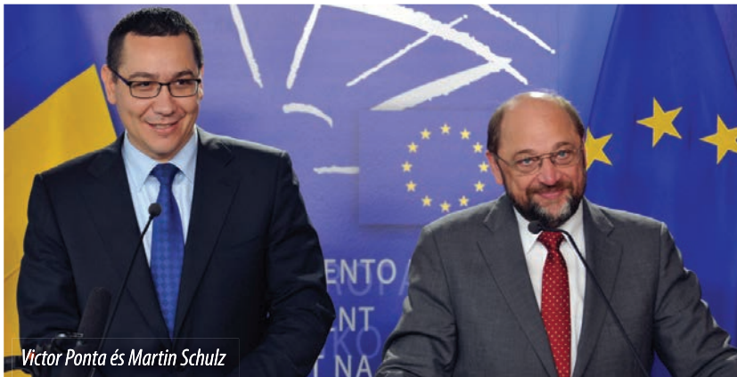
Victor Ponta és Martin Schulz

Az Európai Néppárt kezdeményezésére az Európai Parlament plénumán megrendezett, a mai vitához hozzászólva, a következő írásbeli nyilatkozatot nyújtottam be, a romániai politikai helyzet tárgyában: „Csak üdvözölni lehet, hogy az EP helyt adott a mai vitának – hiszen Romániában maga a demokrácia, a jogállamiság került veszélybe az utóbbi hónapokban.