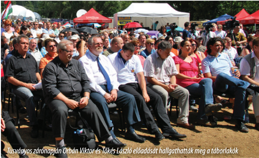
Tusványos zárónapján Orbán Viktor és Tőkés László előadását hallgathatták meg a táborlakók

Örömünkre szolgálhat, hogy itt ülnek közöttünk a magyar nemzetpolitika azon jeles képviselői, akik „Tusványos” – a Bálványosi Nyári Szabadegyetem és Diáktábor – alapító atyái közé tartoznak. Az ő életkorban való előrehaladásukkal együtt érett meg a tusványosi folyamat minden gyümölcse és eredménye, és vált ez a tábor politikaformáló tényezővé, rangos politikai műhellyé. Ha valakiknek, akkor nekik mindenkor itt van a helyük.