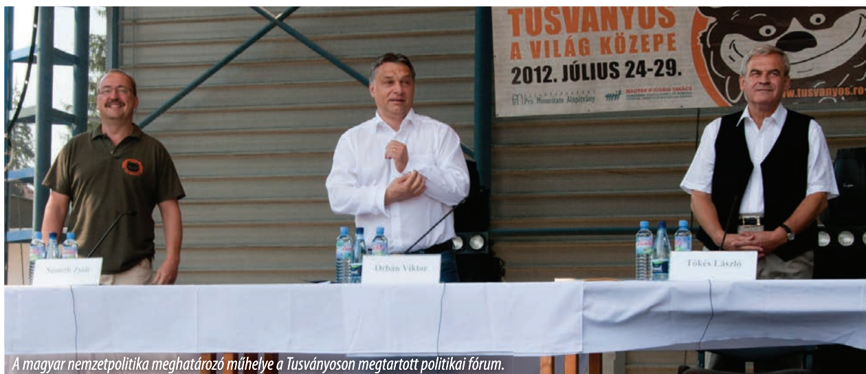
A magyar nemzetpolitika meghatározó műhelye a Tusványoson megtartott politikai fórum.

Tőkés László európai parlamenti képviselő, EMNT-elnök a Bálványosi Nyári Szabadegyetem és Diáktábor jelentőségéről beszélt a Tusványos Pressnek adott interjújában.