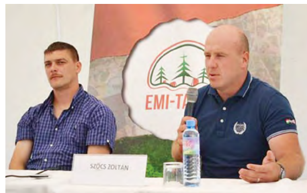
Beke és Szócs

Tőkés Lászlónak végül nem nyílt alkalma az EP plénumán való felszólalásra, ezért mondanivalóját lefelben juttatta el képviselőtársaihoz , valamint a törvényhozás elnökéhez, Antonio Tajanihoz . Lásd alább.